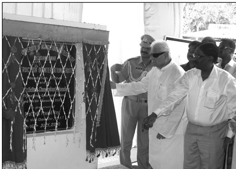
ଓଡ଼ିଶା କୃଷି ବିଶ୍ୱବିଦ୍ୟାଳୟ ପରିସରରେ ରାଜ୍ୟପାଳ ଶ୍ରୀ ମୁରଲୀଧର ଚନ୍ଦ୍ରକାନ୍ତ ଭଞ୍ଜାରେ ଏକ ଛାତ୍ରୀ ନିବାସର ଶୁଭ ଦେଉଛନ୍ତି । ୧୭.୦୭.୧୦