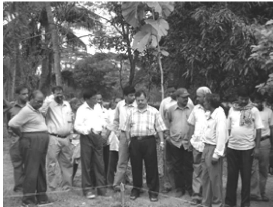
କେନ୍ଦୁଲି ଖନନର ଏକ ଦୃଶ୍ୟ

ଅପରପକ୍ଷରେ ପ୍ରାଚୀ ତୀରର କେନ୍ଦୁଲି ଗ୍ରାମରେ ଷଷ୍ଠ/ସପ୍ତମ ଶତାବ୍ଦୀର ବହୁ ପ୍ରତ୍ନତାତ୍ତ୍ୱିକ ଅବଶେଷ ଦେଖିବାକୁ ମିଳେ । ତତ୍ତ୍ୱଧାରୁ ଶାକ୍ତ, ବୈଷ୍ଣବ ଓ ଶୈବ ମୂର୍ତ୍ତି ସମୂହ ବିଶେଷ ଦର୍ଶନୀୟ । ଏଥିରୁ ମିଳିଥିବା ଲଙ୍କୁଳୀଶା, ଭୈରବ, ମାଧବ ଏବଂ ଅମ୍ବିକାଙ୍କର ପ୍ରାଚୀନ ମୂର୍ତ୍ତି ସମେତ ଜଟାକୁଟ ଧାରଣ ଏକ ଦ୍ୱିଭୁଜ ଅବୟବକୁ କବି ଜୟଦେବଙ୍କର ବୋଲି ବିଶ୍ୱାସ କରାଯାଏ । ଅମ୍ବିକାଙ୍କ ମୂର୍ତ୍ତିଟି ବେଲଗଛ ତଳୁ ମିଳିଥିବା ବେଳେ ଅନ୍ୟ ଏକ ଜାଗେଶ୍ୱରୀ ମୂର୍ତ୍ତି କେନ୍ଦୁଗଛ ମୂଳରୁ ମିଳିଛି । ଏହି ଦୁଇଦେବୀ କେନ୍ଦୁଲିର ଅଧିଷ୍ଠାତ୍ରୀ ଦେବୀ ଭାବେ ଏବେ ବି ପୂଜା ପାଉଛନ୍ତି ।